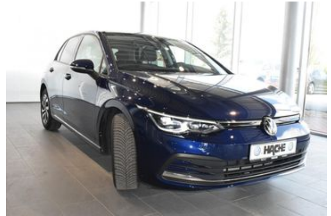
Hermann Hache GmbH + Co. KG