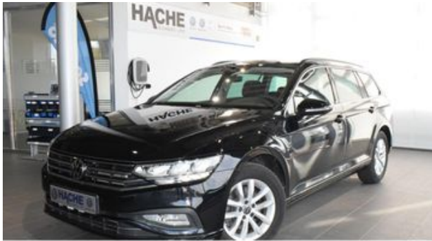
Hermann Hache GmbH + Co. KG