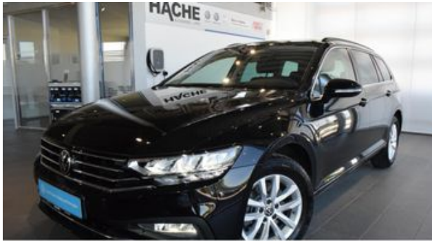
Hermann Hache GmbH + Co. KG