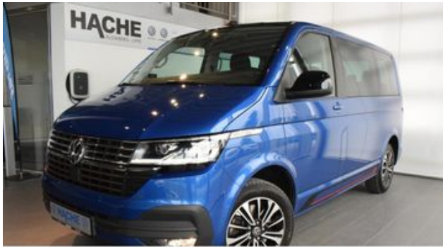
Hermann Hache GmbH + Co. KG