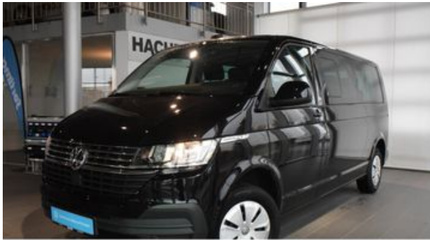
Hermann Hache GmbH + Co. KG