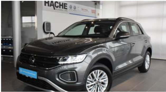
Hermann Hache GmbH + Co. KG