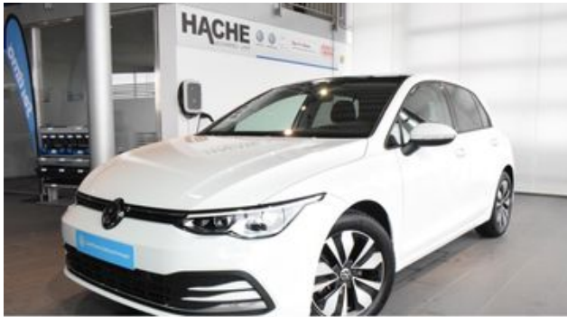
Hermann Hache GmbH + Co. KG