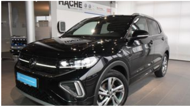
Hermann Hache GmbH + Co. KG