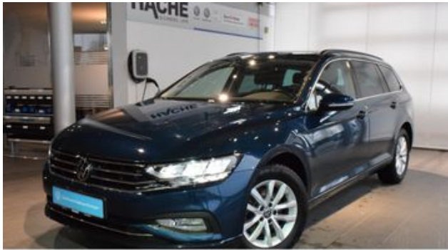
Hermann Hache GmbH + Co. KG