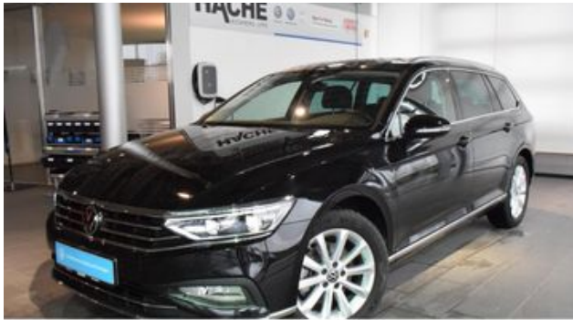
Hermann Hache GmbH + Co. KG