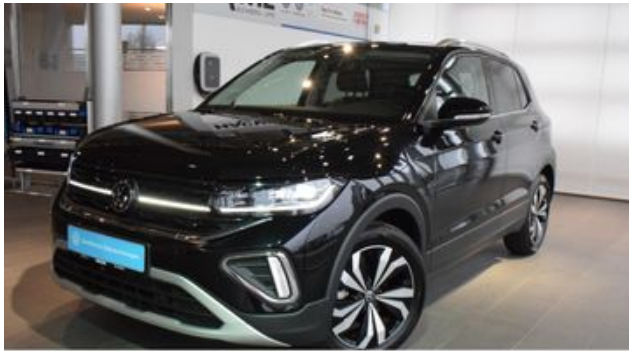
Hermann Hache GmbH + Co. KG